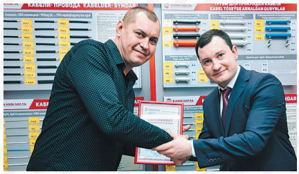
Наш кабель в Казахстане