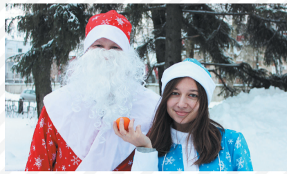
Дед Мороз – в каждый дом