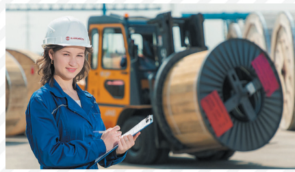
Достижения «Камского кабеля»-2019