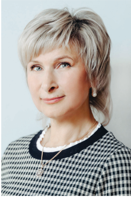
Фото с Доски почета