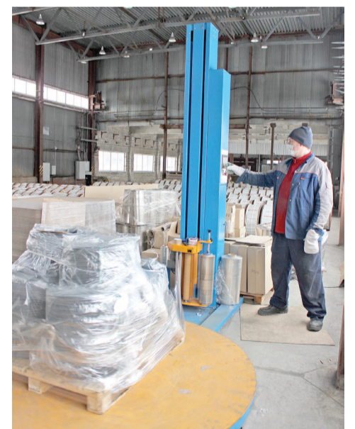
КПП упакуем быстро и аккуратно

В 2020 году склады оборудованы дополнительной техникой, которая позволила