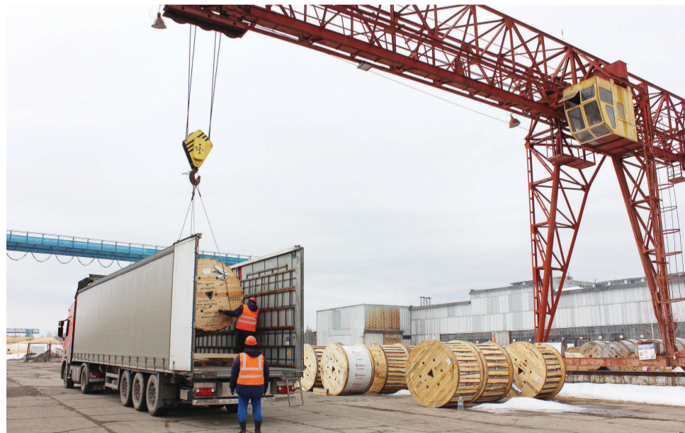
Идет погрузка. Наш кабель отправляется в Татарстан

Отгрузка КПП производится с трех складов завода. Самым крупным по грузообороту является склад №16, с которого отгружается 85-90% объема продукции. В среднем за сутки во все регионы России, а также в страны ближнего и дальнего зарубежья отсюда отправляется 20-25 большегрузных автомобилей. Погрузка выполняется в соответствии с ТУ, но схема размещения и крепления барабанов для каждой машины индивидуальна, зависит от количества и размеров барабанов. Схема расколачива-