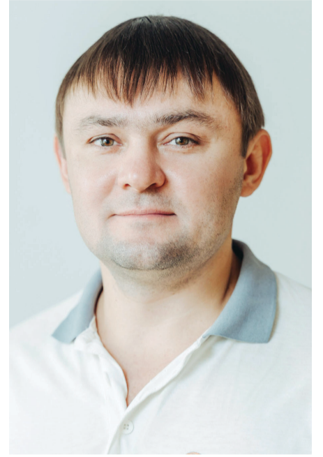
Фото с Доски почета

– Завод – огромный механизм, который заряжает энергией. Идет взаимный обмен: мы даем энергию предприятию, а оно нам. Основная задача мастера – обеспечить персонал всем необходимым, организовать процесс удобно и безопасно. Если рабочий видит, что он не безразличен руководству, что о нем заботятся, то он приложит все усилия к выполнению плана. Это и будет нашим общим достижением. Я на сто процентов уверен в своем коллективе.