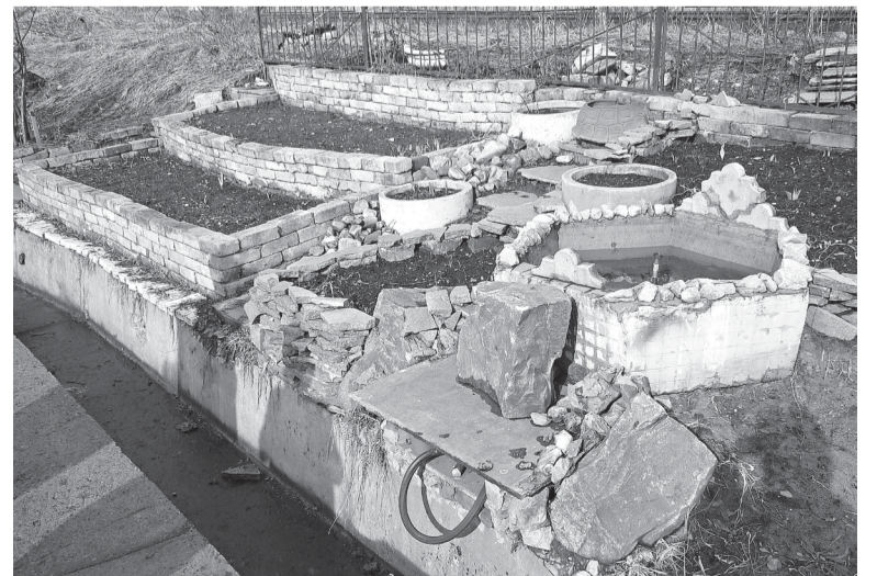
За несколько лет склон превратился в образец ландшафтного дизайна