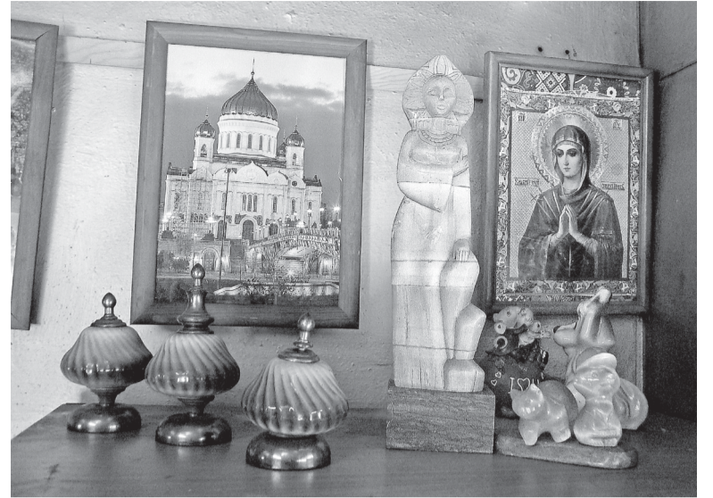
Фрагмент интерьера бытовки аппаратчиков

...За разговором проходим по территории участка и останавливаемся у бытовки аппаратчиков. Оказывается, и возле нее разбита небольшая клумба. А внутри очередной сюрприз: мини-выставка