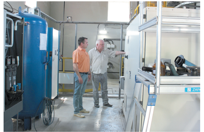
Станция озонирования модернизирована

– Энергетики приступают к осуществлению проекта по переносу стоков второго выпуска (дренажной воды) в первый. Проведены инженерные изыскания, определена