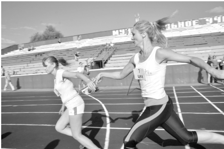
Легкоатлеты «Камкабеля» выйдут на старт юбилейной 50-й эстафеты

Следите за публикациями нашей газеты и новостями в группе «Камкабель» соцсети ВКонтакте.