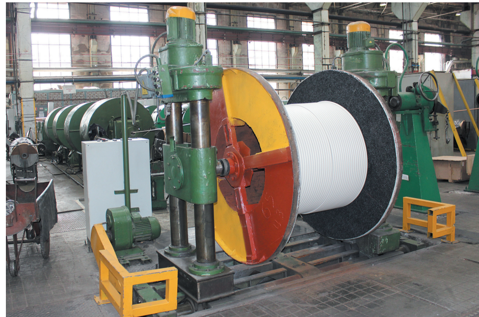
К ключевым заказам на всех этапах проявляется повышенное внимание