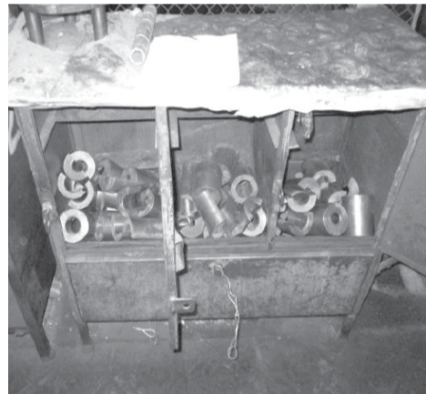
Снимки из серии «было-стало» лучше всяких слов иллюстрируют произошедшие изменения

запасами, потерями транспортировки, ожидания и т.д. Дефекты приводят к переделке, доработке, исправлениям. Сейчас с этим видом потерь работа ведется глубже. Мы изучаем технологическую цепочку, проводим беседы с рабочими, чтобы выявить, под влиянием какого именно фактора получился дефект качества продукции. Значительную экономию можно получить, если сам оператор будет вовремя сигнализировать о работе с дефектом. Японцы, основатели системы Бережливого производства, приравнивают