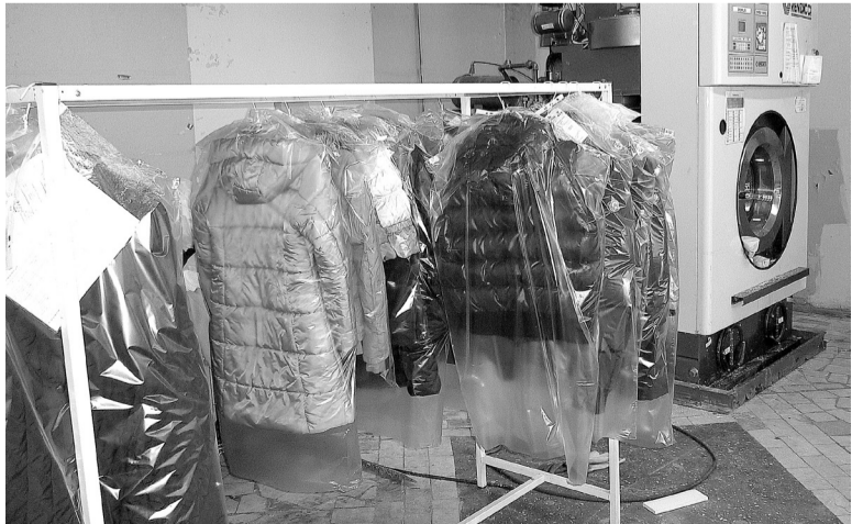
Готовь пуховик летом. Заказы выполняются быстро и качественно