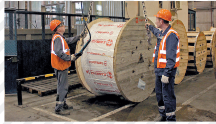
Цех 6 идет на рекорд