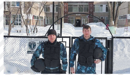
«Меч» на страже детства