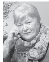
Дети и внуки

Поздравляем тебя с таким достойным юбилеем! Желаем здоровья, радости, позитива, сохранения неустоимости, интереса и любви к жизни. Очень любим тебя, родная, крепко обнимаем и нежно целуем!