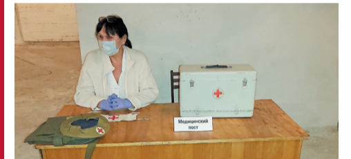
Сотрудники «Камского кабеля» награждены по линии ГО и ЧС.

Наше предприятие отмечено Администрацией города Перми за активное участие в мероприятиях, проводимых в рамках Всероссийской штабной тренировки по гражданской обороне, а также за поддержание в готовности сил и средств ГО и РСЧС (Единой государственной системы предупреждения и ликвидации чрезвычайных ситуаций).