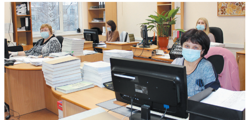
Ответственно трудится коллектив бюро расчетов с поставщиками и покупателями

Каждый год богат на изменения в законодательстве, и 2020-й — не исключение. Руководство службы, начальники бюро постоянно отслеживают нововведения, учитывают