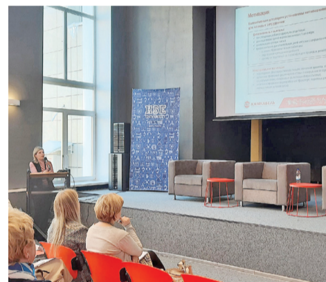
«Камский кабель» принял участие в краевой конференции.

11 марта состоялась первая региональная конференция «Корпоративная молодежная политика в Пермском крае».