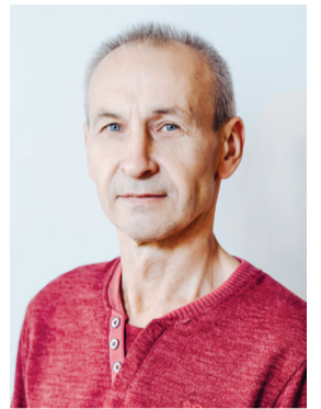
Фото с Доски почета