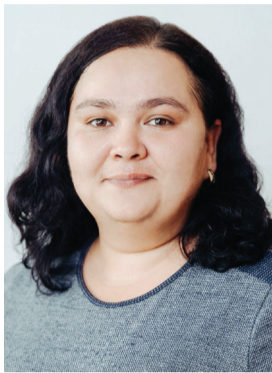
Фото с Доски почета

Основная задача – ответственно выполнять свои повседневные обязанности. В этом помогает коллектив. Все трудятся слаженно, дружно. Мастера имеют большой опыт работы на участке. Наступил высокий сезон, ждем большие объемы продукции и готовы их обрабатывать.