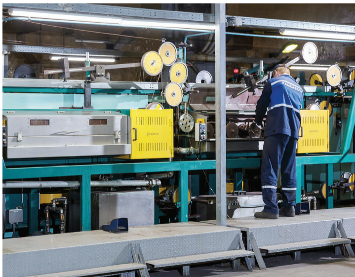
Продукцию цеха 5 ждут международные концерны, потребители в ближнем и дальнем зарубежье