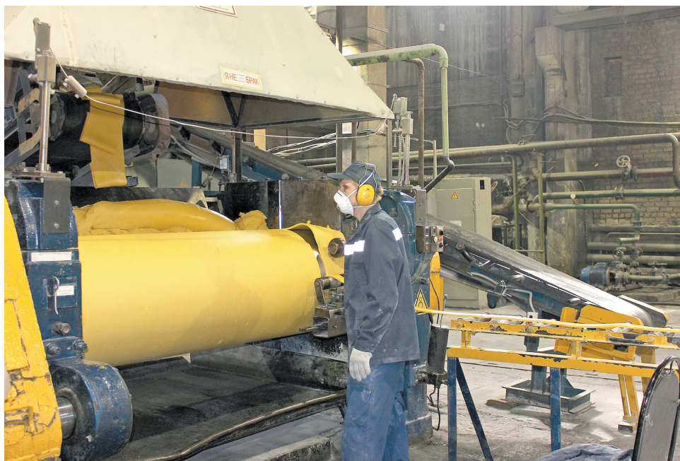
Персонал РДУ принимает активное участие в обновлениях

марки резины для производства кабелей под потребности конкретного заказчика. Процесс совершенствования кабелей с резиновой изоляцией затрагивает все этапы, начиная от закупки и входного контроля сырья по новым требованиям. Изменение рецептур резиновых смесей и выпуск опытных партий влечет за собой изменение технологических процессов. В этом мы находим полное понимание с коллегами из КТБ ШК и персоналом цеха 2. Рабочие РДУ и ИШУ — настоящие профессионалы. Они с интересом воспринимают происходящие перемены, мобильны, готовы обучаться и совершенствовать качество выпускаемой продукции, повышая ее конкурентоспособность.