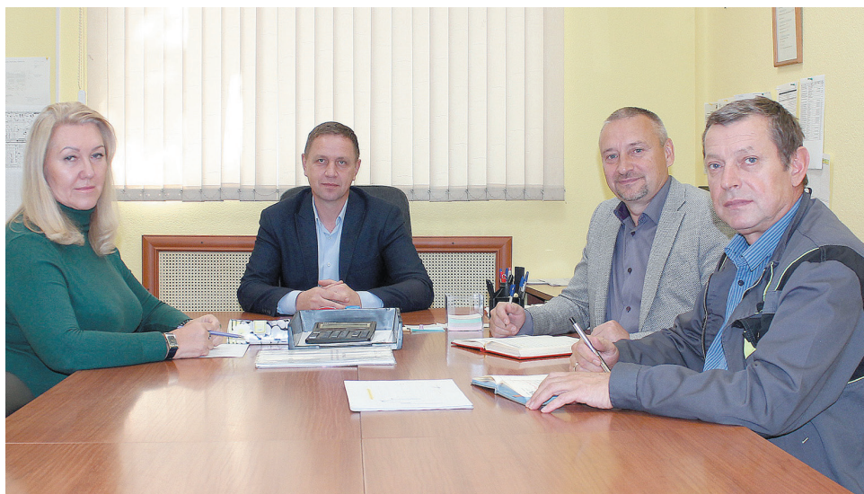
Производственники и технологи работают в постоянном контакте

Руководство компании уделяет большое внимание техническому перевооружению. Благодаря приобретению передового оборудования мы можем с высокой точностью определять различные характеристики резиновых смесей всех изготовленных замесов для получения качественной готовой продукции. Нормы установлены жесткие, и анализ показывает, что практически все резиновые смеси им соответствуют. Кроме того, бюро развития резин оснастили собственным лабораторным резиносмесителем. Он позволяет экономить материалы, своевременно отрабатывать режимы смешения резиновых смесей и опытную рецептуру по импортозамещению с трансляцией в производство, осуществлять входной контроль материалов. Новым оборудованием оснащается и лаборатория резин ЦЗЛ. Это позволяет за сравнительно короткое время создавать исключительные