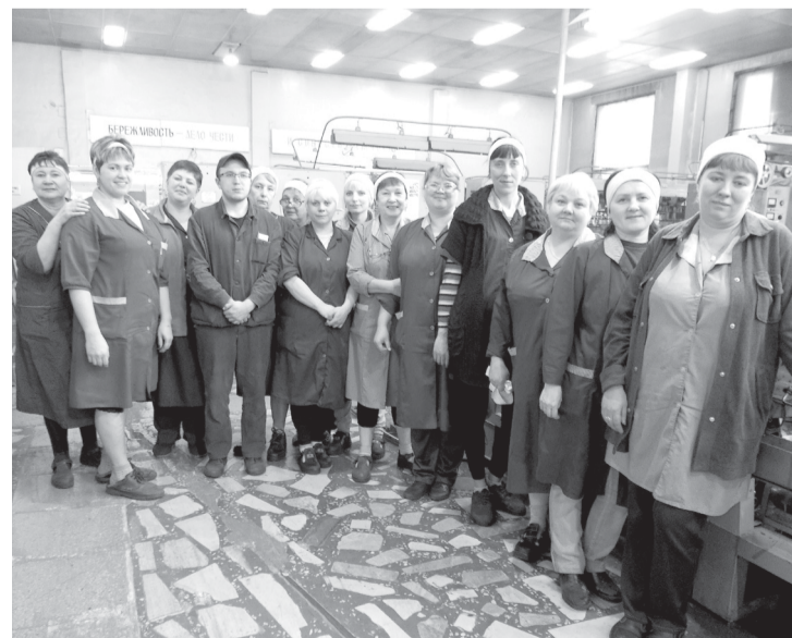
Коллектив участка скрутки жилы, изолирования и термообработки проводов