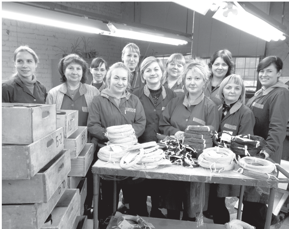
Дружный коллектив испытателей готовой продукции работой обеспечен

– Во многих авиационных, космических аппаратах применяются провода, выпускаемые цехом 7. Его продукция используется в военной и гражданской технике на земле, в воздухе и под водой. В данной группе номенклатуры «Камский кабель» занимает лидирующую позицию. Так сложилось исторически, и цех держит марку. В той сфере промышленности, в которой используется наша продукция, люди работают подолгу, сохраняют воспоминания о сотрудничестве с «Камкабелем» еще с 1970-80-х годов, долго помнят добро. Бывает приятно в разных уголках страны встречать руководителей и специалистов, бывавших в Перми и хорошо знающих продукцию цеха теплостойких кабелей и проводов.