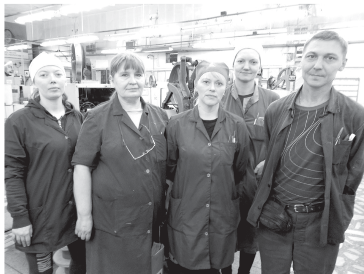
Сотрудники участка оплетки обслуживают множество единиц оборудования, успевают следить за порядком