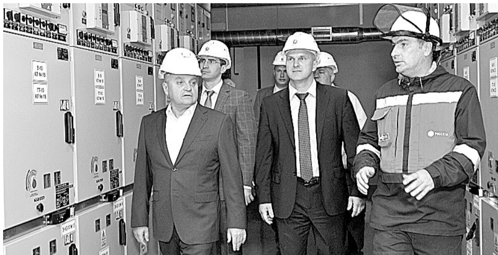
Замминистра энергетики А.В. Черезов (на снимке – слева) положительно оценил ход работ по подготовке энергообъектов Ростова-на-Дону к проведению ЧМ-2018.

матуры. Таким образом, кабельная система поставлена заказчику «под ключ».