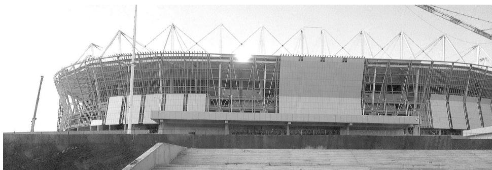
Стадион вместит 45 тысяч зрителей