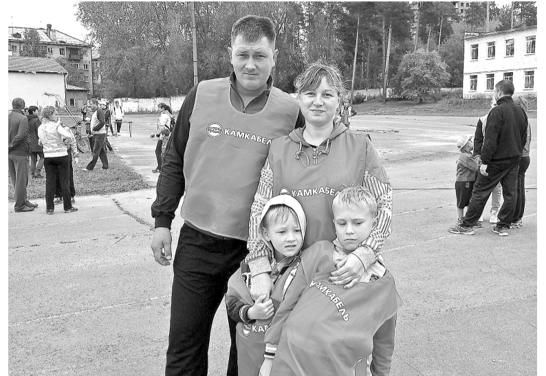
«Когда позволяет время, любим активно проводить выходные всей семьей!»