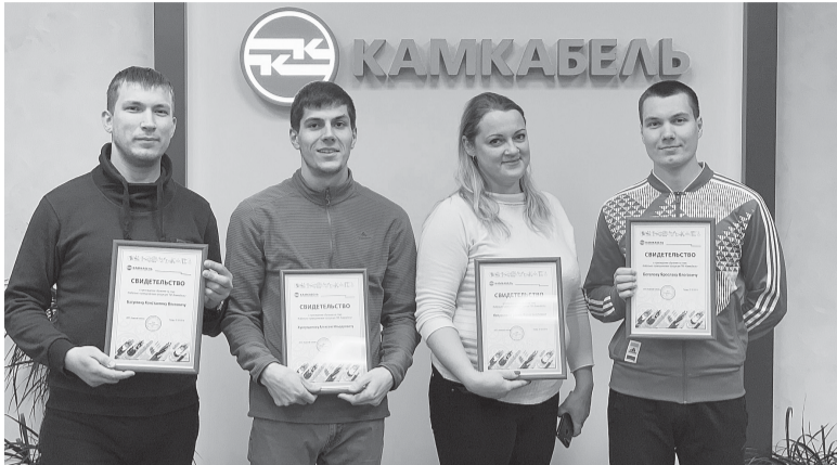
Представители гипермаркета «Леруа Мерлен» посетили «Камский кабель».

Наше сотрудничество с сетью гипермаркетов товаров для строительства, отделки и обустройства дома началось около года назад. Продукция с торговой маркой «Камкабель» успешно продается в Перми, Екатеринбурге и Уфе.