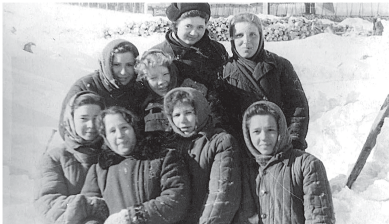
Первые кабельщики привлекались к работам по возведению заводских корпусов

мирное счастливое русло. И в это время правительством страны было решено начать строительство завода-флагмана, крупнейшего в своей отрасли, стране и Европе. Ставилась задача: с учетом последних достижений науки и передовых технологий обеспечить Страну Советов собственной лучшей кабельной продукцией.